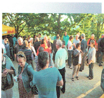
Une buvette prise d'assaut